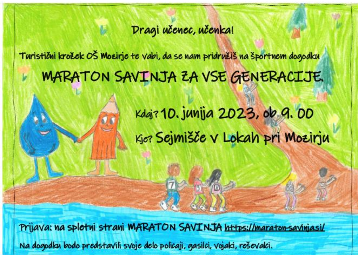
Slika 1: Vabilo na spletni strani šole, šolskih oglasnih deskah

Na dogodek bomo povabili učence naše šole in tudi ostale prebivalce našega kraja. Vabilo (Slika 1) bomo izobesili v šoli in na spletni strani šole ter v mesečnem koledarju prireditev v občini Mozirje.