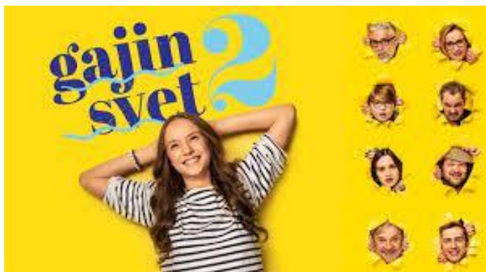
Slika s spleta

Film mi je bil zelo všeč in ga vsem priporočam.