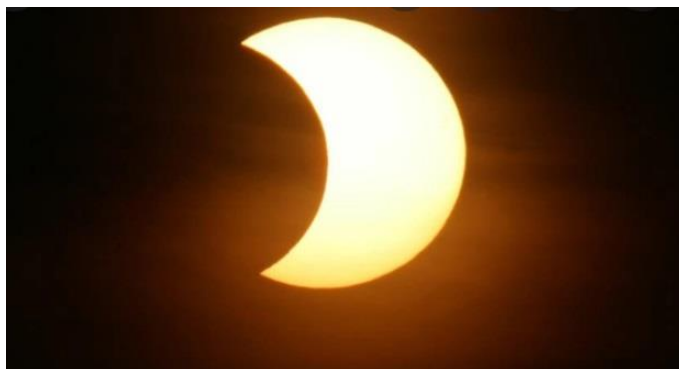
Slika s spleta

V torek, 25. oktobra, se je v Sloveniji zgodil delni Sončev mrk. Začel se je nekaj po 11. uri in končal nekaj čez 13. uro popoldne. Takrat se je Lunina ploskev prvič navidezno dotaknila Sončeve ploskve. Luna je zakrila del Sonca. Ogledali smo si ga skozi posebna očala, saj je Sončeva svetloba premočna za naše oči in bi lahko pustila velike posledice.