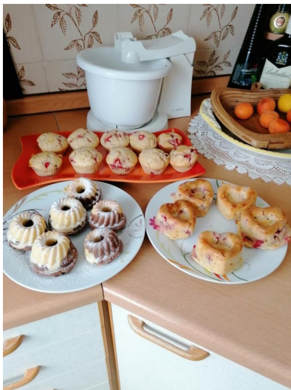
Enej Poličnik in njegovi izdelki